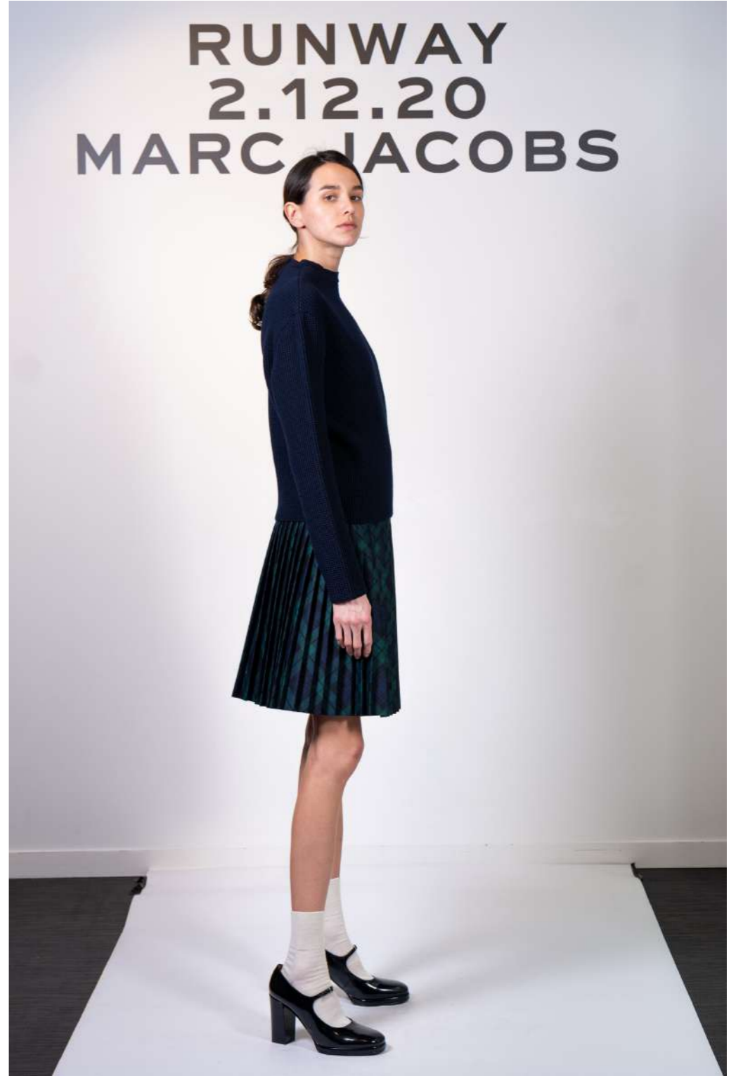
MARC JACOBS - 2020