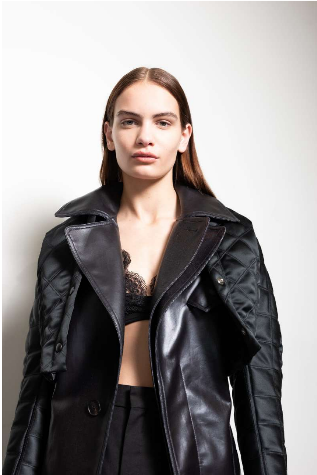
ATLEIN - 2020