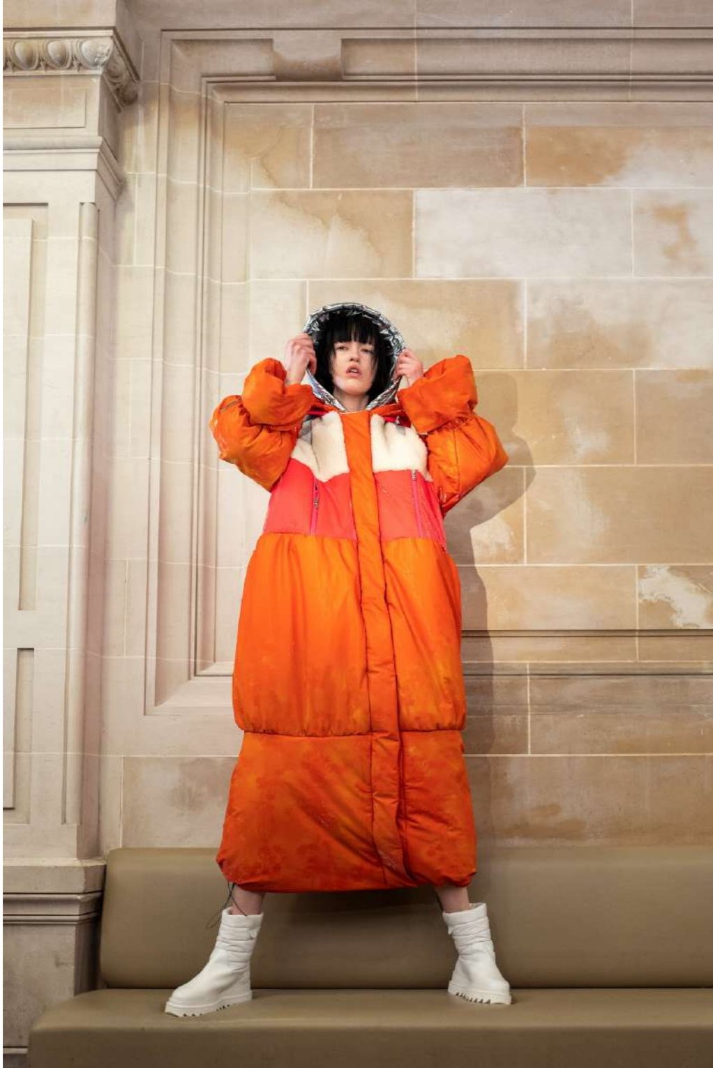
TATRAS - 2020