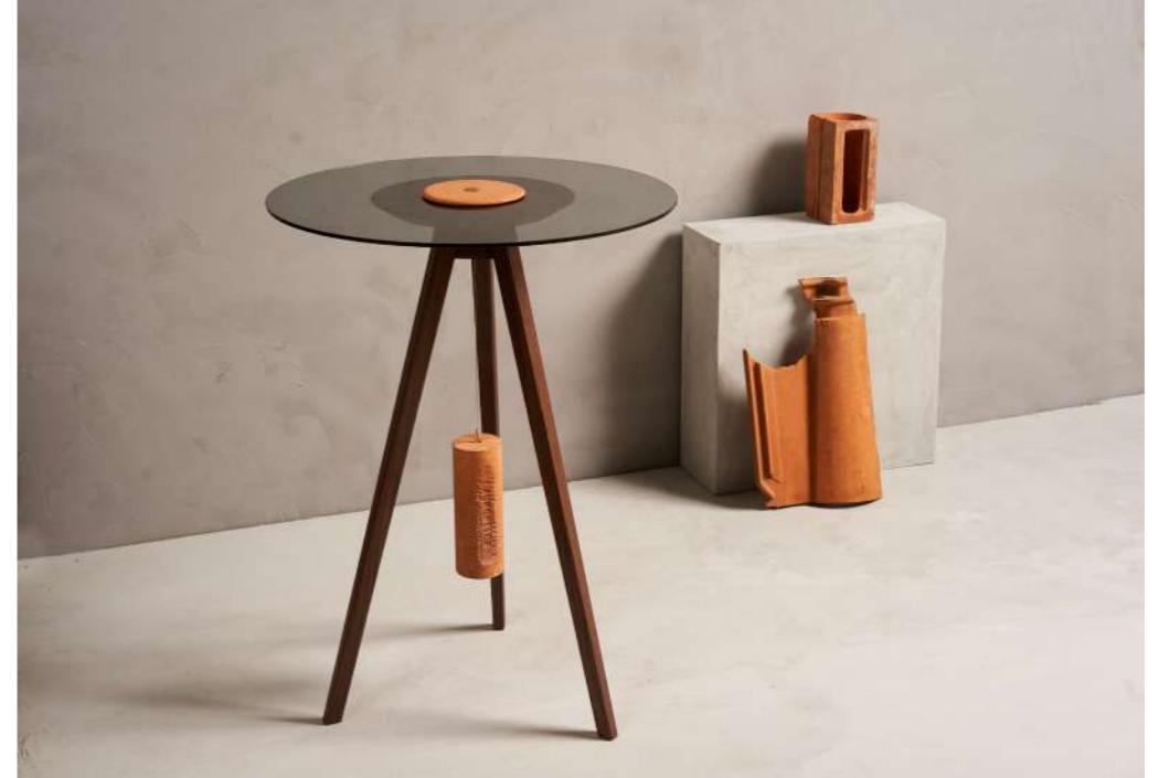
DIMITRY HLINKA - 2021