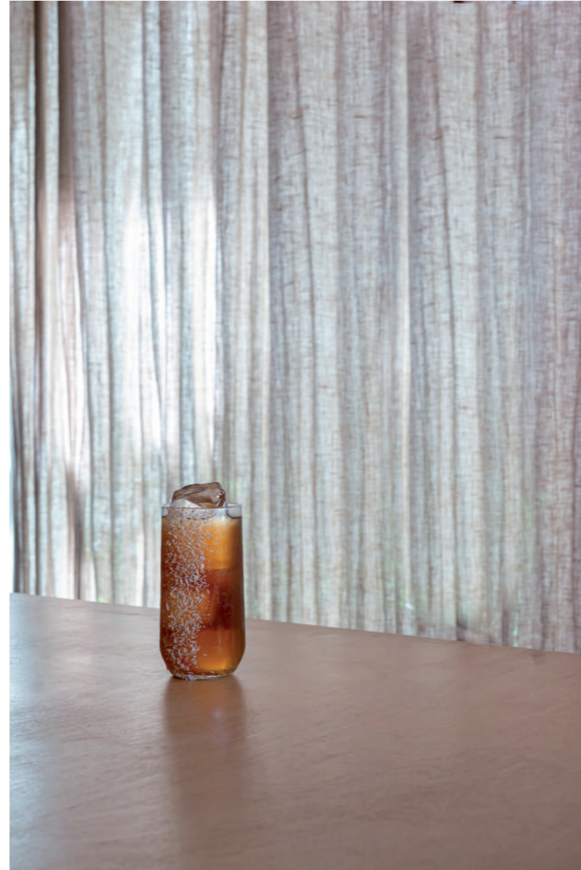
KRAKEN - 2021