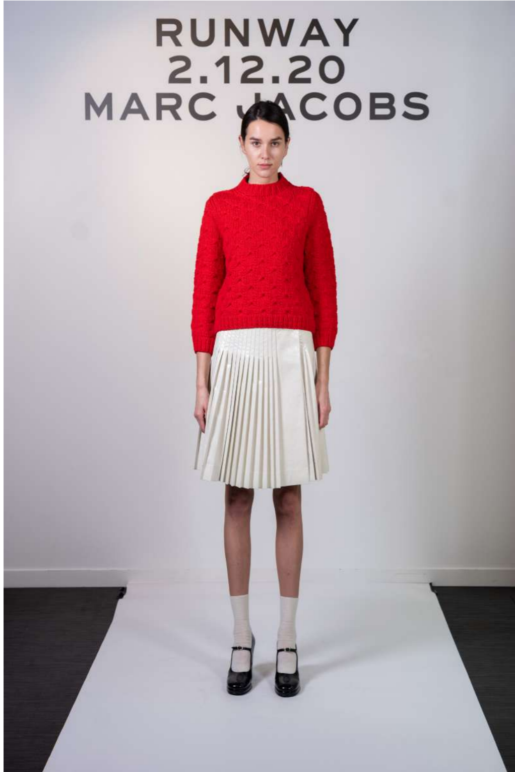
MARC JACOBS - 2020