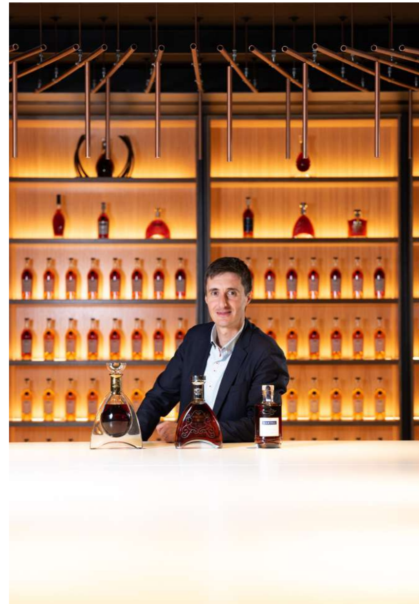
MARTELL - 2021