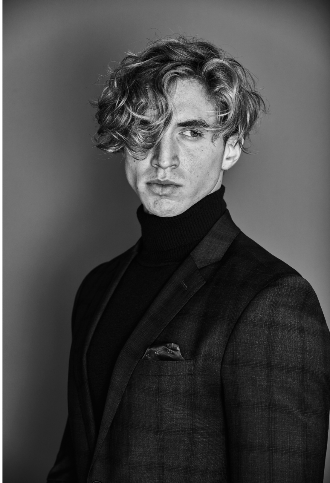
AMERICAN CREW - 2020